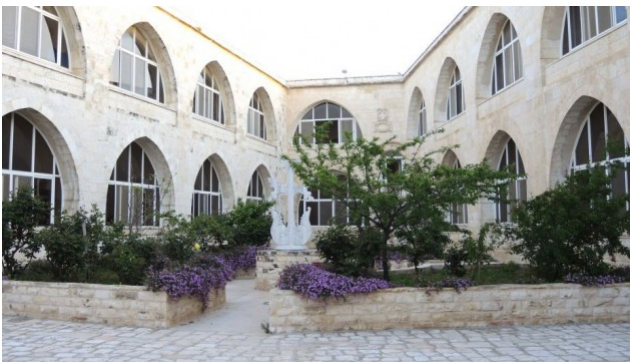
Des mysostis, le symbole du 100e anniversaire du génocide arménien, dans une cour du monastère dans la vieille ville de Jérusalem

Le télégramme, qui avait été écrit à l'origine en langage codé, est une demande de détails sur le terrain de la part d'un responsable turc de haut-rang, Behaeddin Shakir, sur les déportations et les meurtres d'Arméniens dans la région de l'Anatolie, située dans l'est de la Turquie, dit l'article de presse.