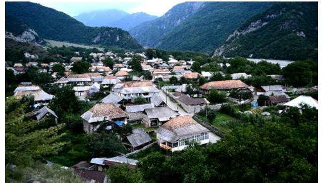
Վարդաշէն / Օղուզ

Ի վերջոյ, ի՞նչն էր հայերն ու ուտիները միաւորողը: